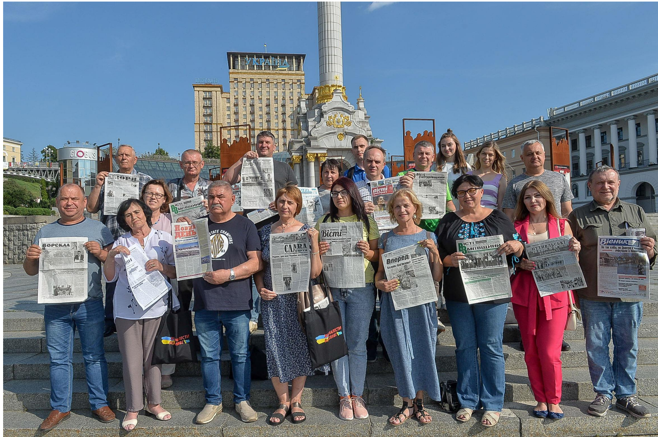
Press Perseveres : July 2023, Kyiv's Independence Square (Maidan). Editors from 15 frontline newspapers showcase their revived publications, a testament to the collaborative efforts of the NUJU and global supporters in sustaining vital local journalism during the war.