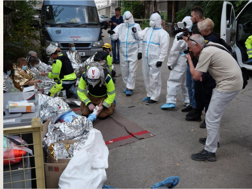
Safety trainings on skills for frontline work