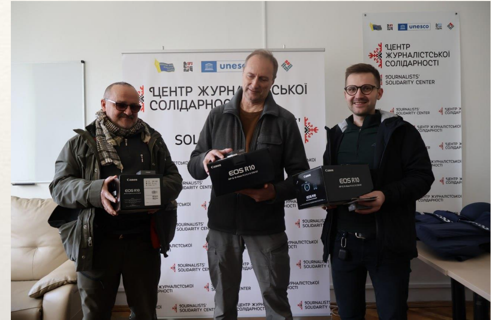
Technical assistance: laptops, cameras, power banks...