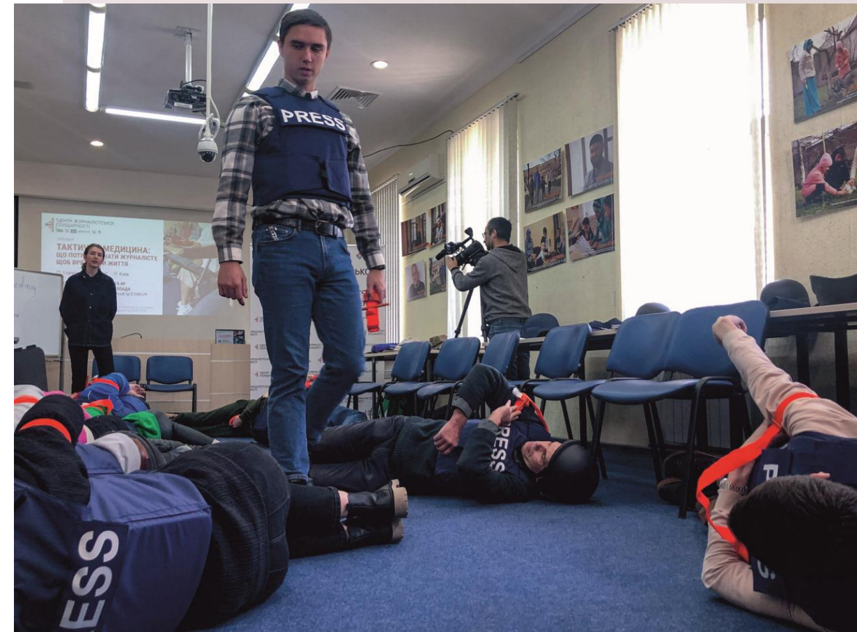
Safety training, office of NUJU, Kyiv