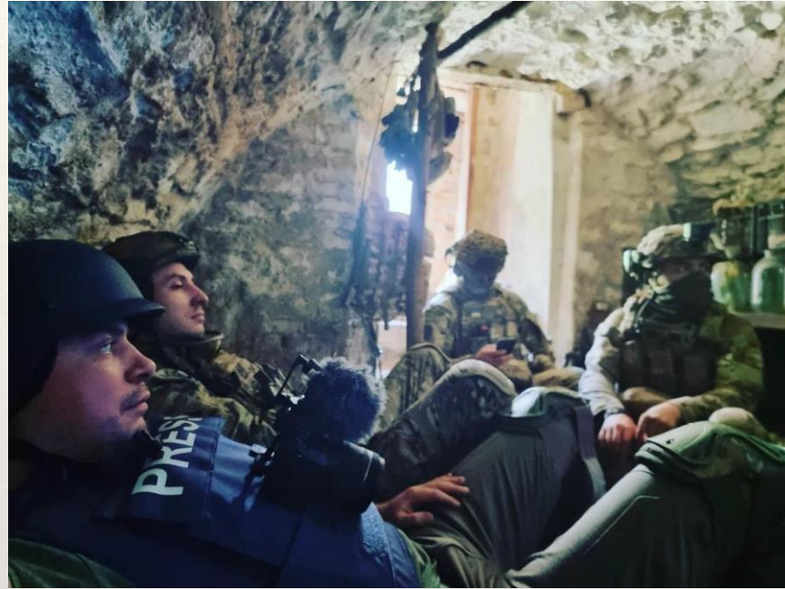
Protective equipment: bulletproof vest, helmets, IFAK first-aid kits